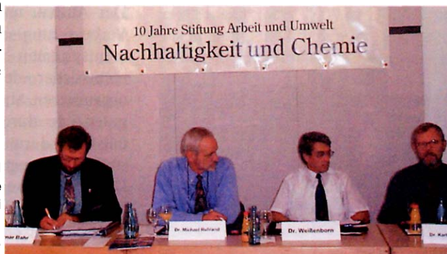
Stiftung Arbeit und Umwelt: Öffentliche Diskussionen helfen bei der Aufarbeitung von Problemen.